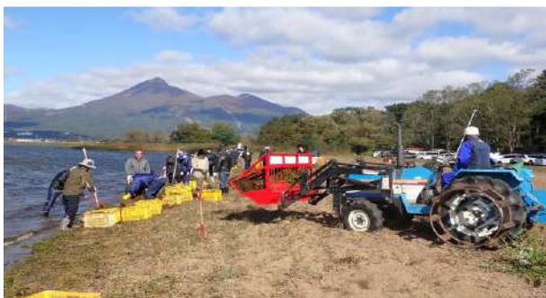
水草回収用トラクターが機動力発揮！(10/20)