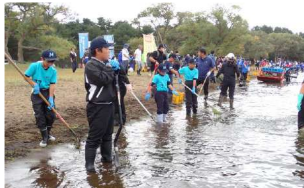
高齢化が進む水草回収活動。「私たち若い力で猪苗代湖を守りたい！」頼もしい決意(10/13・10/19)