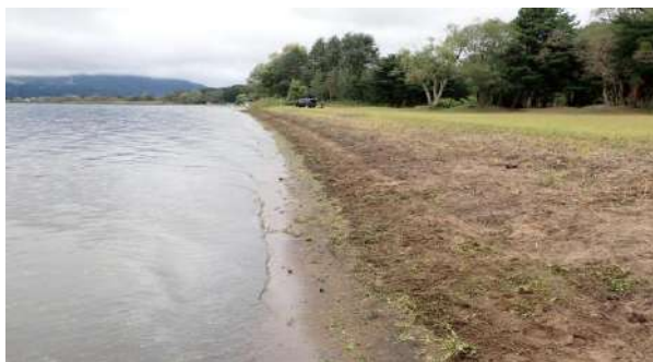
水草回収後、浜辺はこんなにきれいに！(10/20)