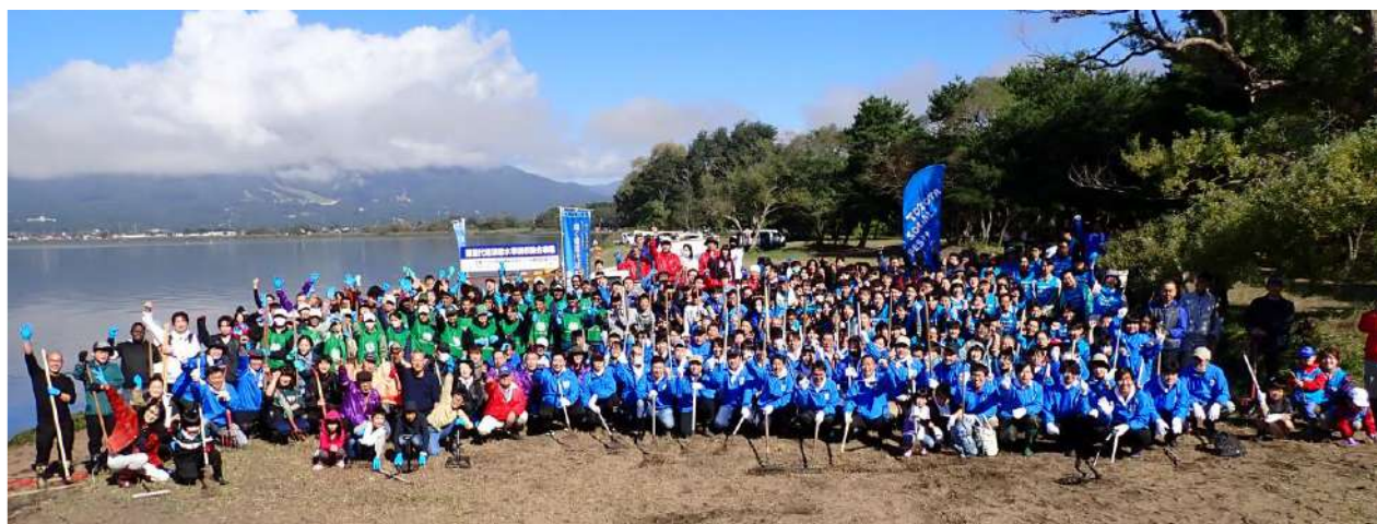
第2回漂着水草回収除去活動に 346 名が参加し、天神浜がとてもきれいになりました(10/26)