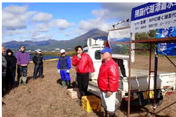
長友事務局の進行で開会式を始めます(10/20)