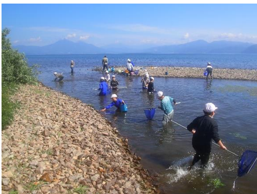
待ちに待った鬼沼の水質水生生物採取開始！