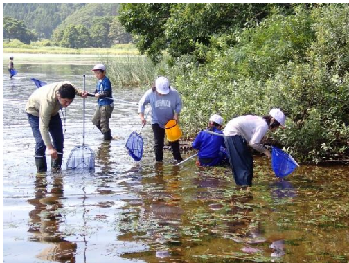
先生！こっちにもたくさん水生動物がいます！