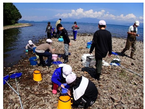
採取した水生生物を優しく鬼沼にもどす様子