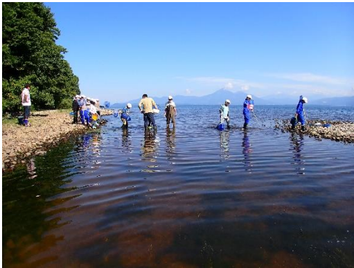
鬼沼の“砂し”をわたる子どもたちの様子