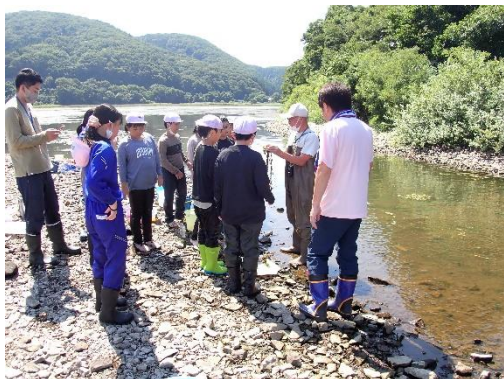
中村先生から水生植物名を聞いている様子