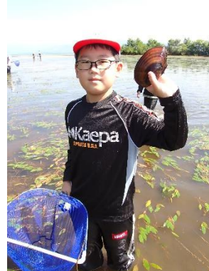
見つけたよ！でっかいカラスガイ！