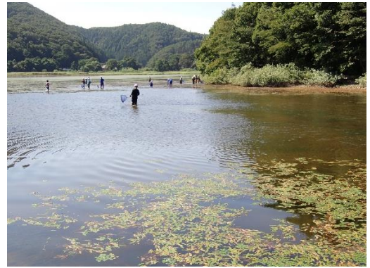
鬼沼も広い！でもどんどん水生生物をさがせる！